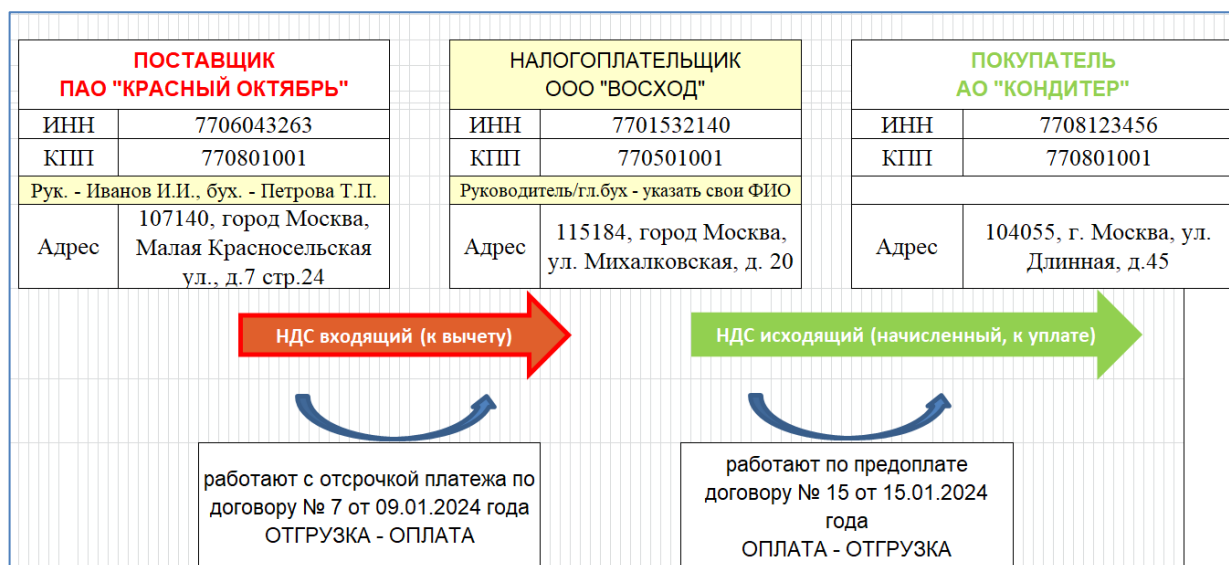
Рисунок 1 – Реквизиты сторон