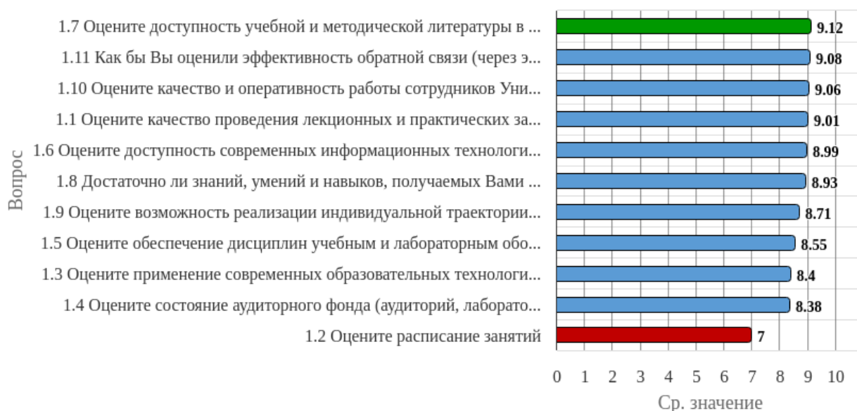
Рисунок 1.1 - Распределение показателей уровня удовлетворённости студентов по блоку вопросов «Удовлетворенность организацией, содержанием и качеством образовательного процесса.»

Индекс удовлетворённости по блоку вопросов «Удовлетворенность организацией, содержанием и качеством образовательного процесса.» равен 8.66.