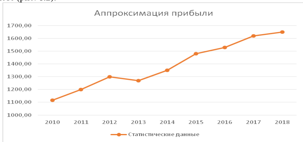
Рис. 6.2 - Прибыль предприятия за 2010-2018 гг.

Оформите диаграмму: ввести нужные заголовки и форматы, разместить на отдельном рабочем листе (рис. 6.2).