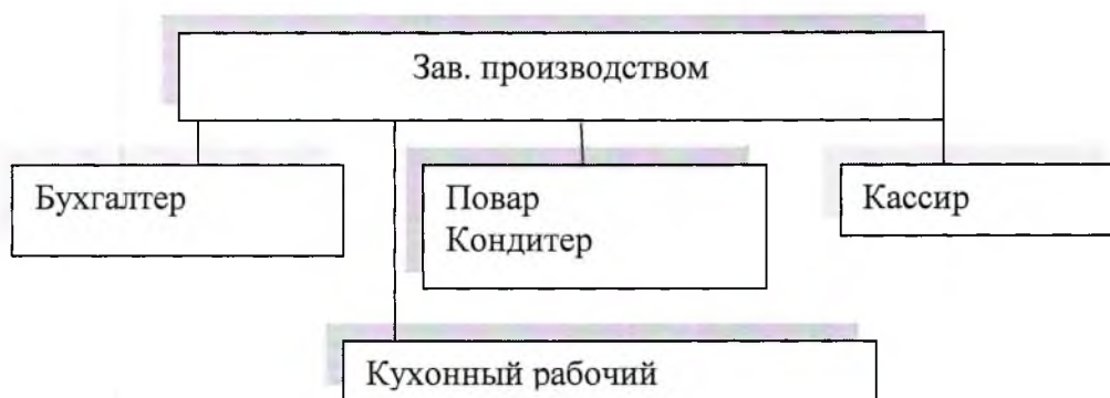
Рис. 1 Структура УТК

функциями отражается в штатном расписании, представлена на рис.1.