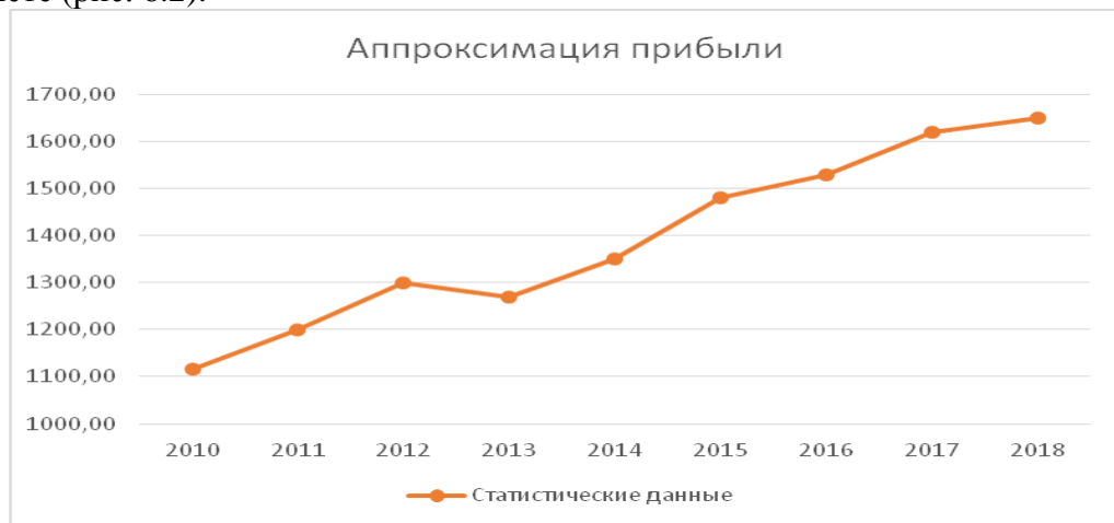
Рис. 6.2 - Прибыль предприятия за 2010-2018 гг.

Оформите диаграмму: ввести нужные заголовки и форматы, разместить на отдельном рабочем листе (рис. 6.2).