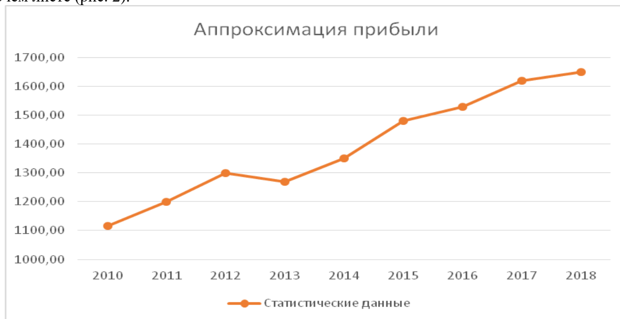
Рис. 2 - Прибыль предприятия за 2010-2018 гг.

Оформите диаграмму: ввести нужные заголовки и форматы, разместить на отдельном рабочем листе (рис. 2).