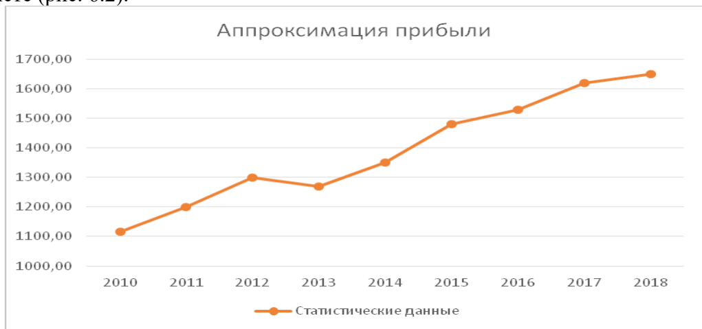
Рис. 6.2 - Прибыль предприятия за 2010-2018 гг.

Оформите диаграмму: ввести нужные заголовки и форматы, разместить на отдельном рабочем листе (рис. 6.2).