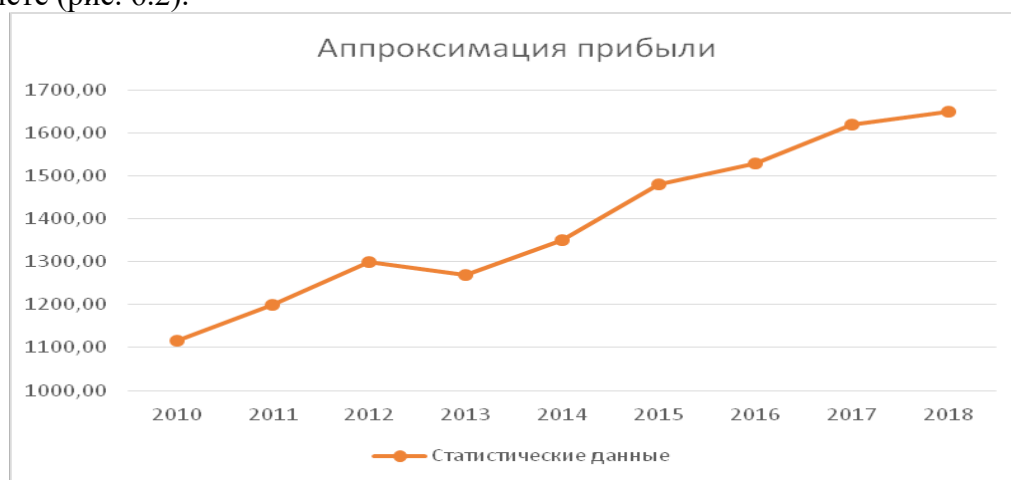
Рис. 6.2 - Прибыль предприятия за 2010-2018 гг.

Оформите диаграмму: ввести нужные заголовки и форматы, разместить на отдельном рабочем листе (рис. 6.2).