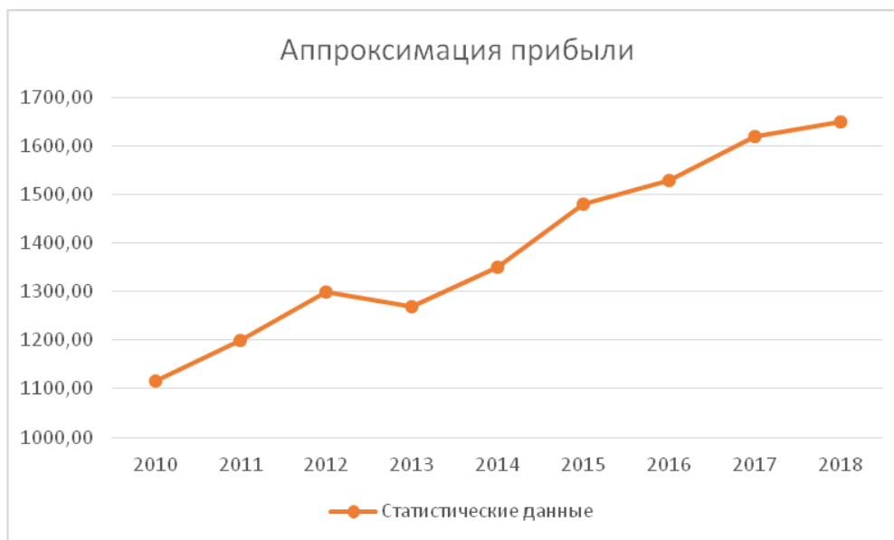
Рис. 2. Прибыль предприятия за 2010-2018гг.