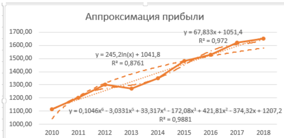
Рис. 5. Тренды прибыли предприятия

Отформатируйте линию логарифмического тренда по собственному усмотрению (цвет, тип штриха и т.п.)