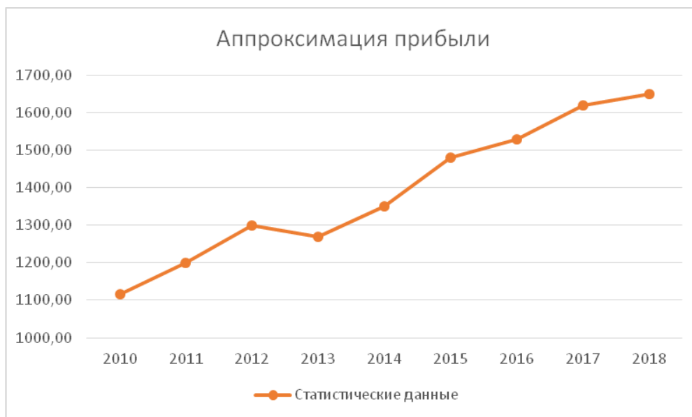
Рис. 2. Прибыль предприятия за 2010-2018гг.