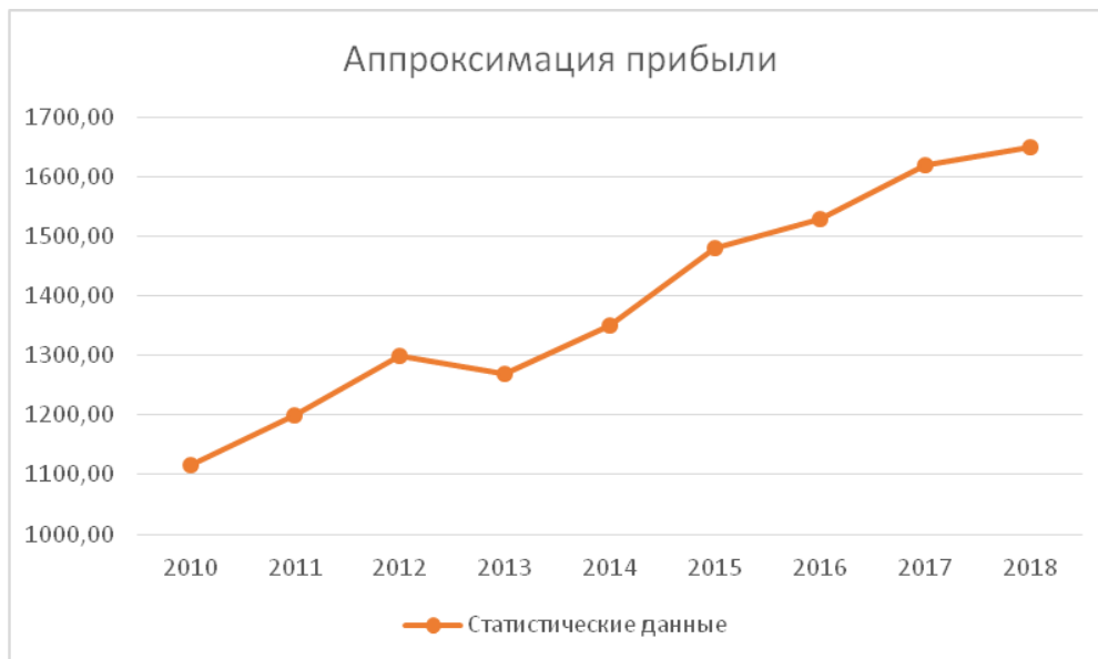
Рис. 2. Прибыль предприятия за 2010-2018 гг.