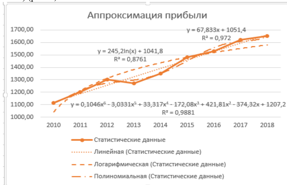
Рис. 5 - Тренды прибыли предприятия

Отформатируйте линию логарифмического тренда по собственному усмотрению (цвет, тип штриха и т.п.) (рис. 5)