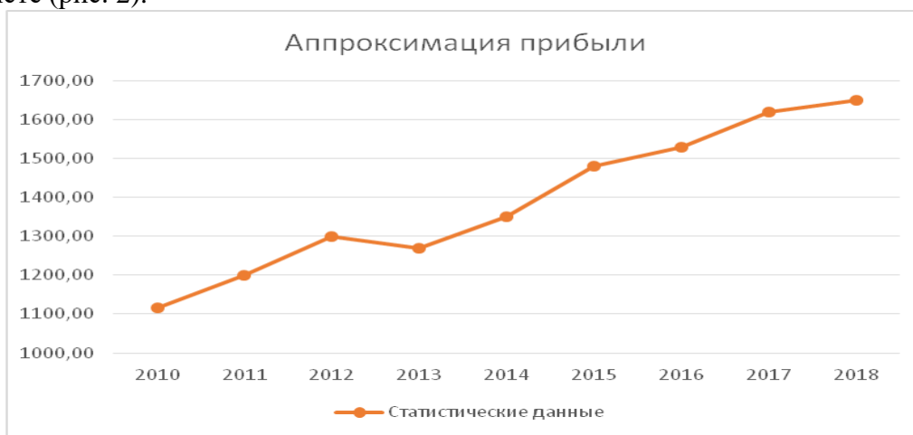
Рис. 2 - Прибыль предприятия за 2010-2018 гг.

Оформите диаграмму: ввести нужные заголовки и форматы, разместить на отдельном рабочем листе (рис. 2).